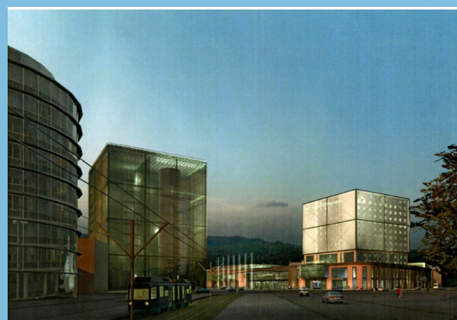
Ansicht bei Nacht

Das Internationale Congress-Centrum Heidelberg ist als PPP-Projekt von der Projektgesellschaft entwickelt worden. Durch die freihändige Angebotsaufforderung sind Einsprüche von unterlegenen Bieter erfolgt und das Angebotsverfahren aufgehoben worden. Zur Zeit befindet sich das Projekt in der Vorbereitung zur europaweiten Ausschreibung.